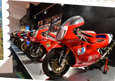
Moto dei Miti