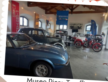
Museo Piero Taruffi