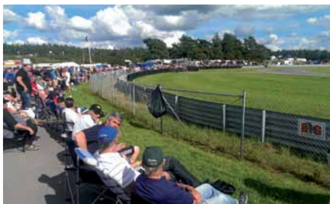
Il folto e variegato pubblico dell'evento