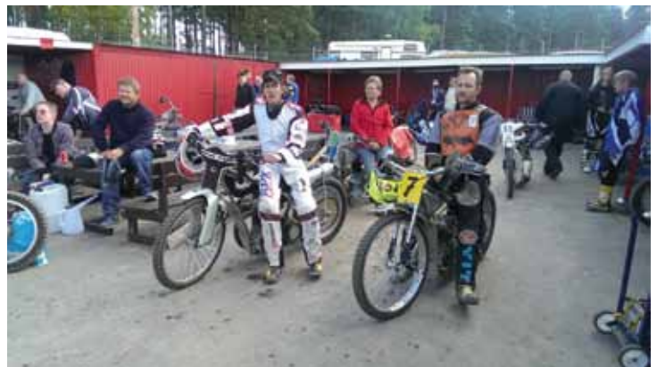
Lo spazio dedicato all'esposizione moto e foto, e alla premiazione dei campioni