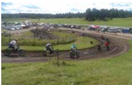
Una delle gare di motocross d'epoca sul percorso del Motorstadion