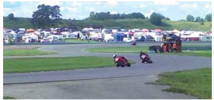
Una gara di velocità sul circuito del Motorstadion