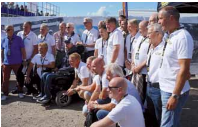
Il gruppo dei 25 campioni mondiali svedesi premiati