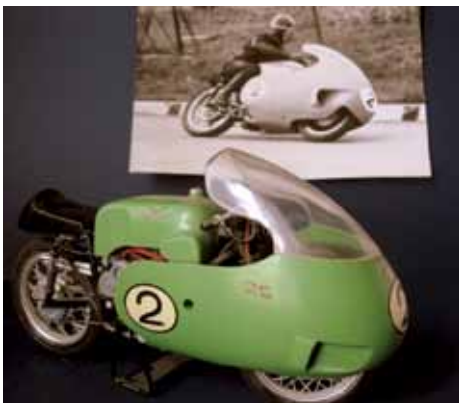
Imola, 22 aprile 1957. 4ª Coppa d'oro Shell, modellino Protar della Guzzi 8 cilindri e Dickie Dale alla Tosa.

Le gare di Imola, sebbene costellate da numerose cadute, diedero chiare indicazioni tecniche per il Campionato Mondiale: nelle 250 vinse Provini (Mondial) davanti a Ubbiali (MV), nelle 350 giunse primo Liberati (Gilera), nelle 500 vinse di prepotenza la Guzzi 8 cilindri di Dale. Le competizioni mondiali iniziarono il 19 maggio a Hockenheim e furono