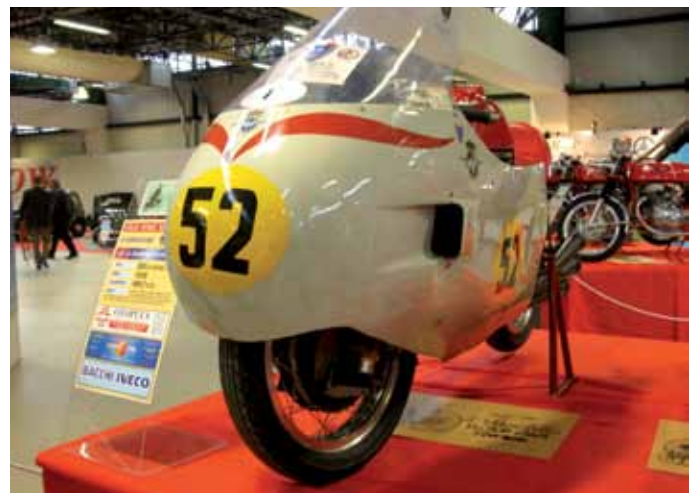
Forlì, 9 marzo 2013. Hold Time Show MV Agusta 500 6 cilindri. Collaudata a Monza da Nello Paganì nel corso del 1957.