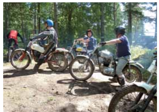
Un momento della gara di trial nei boschi del Motorstadion