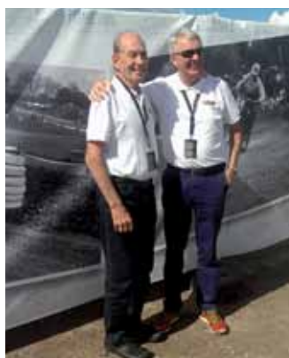
I campioni del mondo Rolf Tibblin e Torsten Hallman