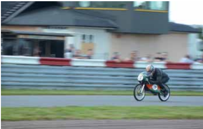
Una gara di velocità sul circuito del Motorstadion