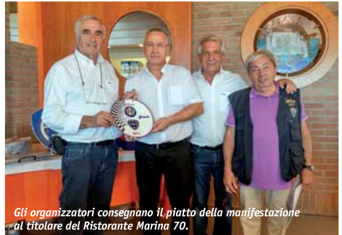
Gli organizzatori consegnano il piatto della manifestazione al titolare del Ristorante Marina 70.