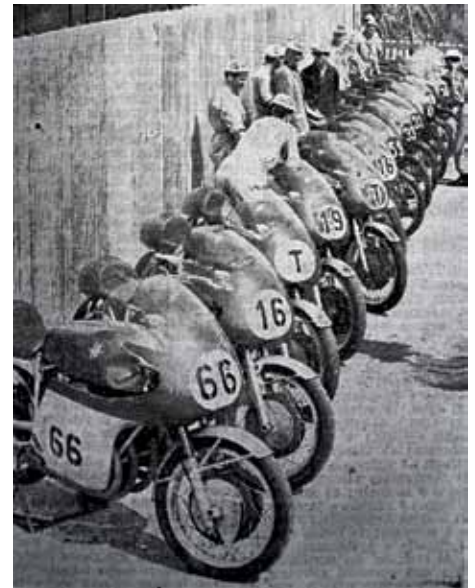
Imola, 25 aprile 1960. 7ª Coppa d'oro Shell, Box MV Agusta: il formidabile schieramento delle 18 moto MV ufficiali ci lascia ancora oggi impressionati. Stadio, 25 aprile 1960