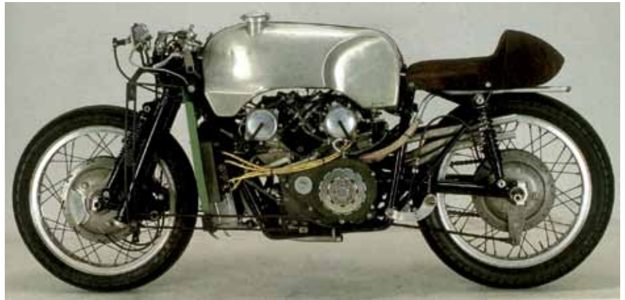
Campionato Mondiale 1957 Guzzi 8 cilindri priva di carenatura. Peso con pilota kg 237,5. Velocità max. 275 km/h

Il 27 settembre 1957 Mondial, Guzzi e Gilera, che avevano stravinto i Mondiali Marche e Piloti, annunciarono alla stampa perplessa, con un comunicato congiunto, il loro ritiro ufficiale dalle competizioni di velocità: "... le vittorie conquistate, indiscutibilmente probanti per i risultati tecnici conseguiti, non hanno avuto all'estero termini di confronto per l'assenza dell'industria degli altri paesi, mentre in Italia le competizioni si sono svolte in un clima di continue incertezze e difficoltà dovute a particolari orientamenti delle autorità e di talune sfere dell'opinione pubblica. Le prestazioni delle macchine da corsa hanno ormai raggiunto livelli di rendimento tali da rendere perplessi di fronte al rischio per i corridori e all'alea per i risultati che le Case si propongono ..."