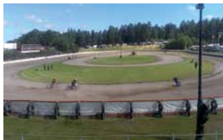
Una gara di speedway nella pista ad anello con fondo sabbioso