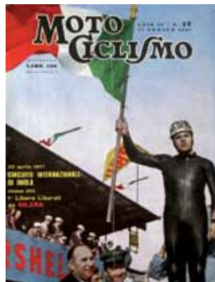
Imola, 22 aprile 1957. 4ª Coppa d'oro Shell, classe 350cc: Libero Liberati sul podio; In primo piano G Gilera. Motociclismo n.17, 1957