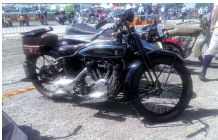
Nella mostra-scambio, una Husqvarna bicilindrica del 1925

Se volete vedere un buon servizio in video sull'evento di Linköping, potete visitare YouTube al seguente indirizzo internet: https://www.youtube.com/watch?v=vmObTX-LIEQ