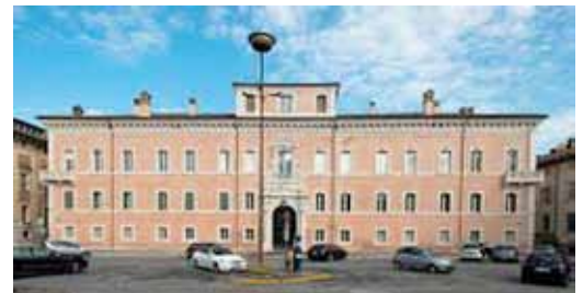
Palazzo Rasponi dalle Teste - Ravenna