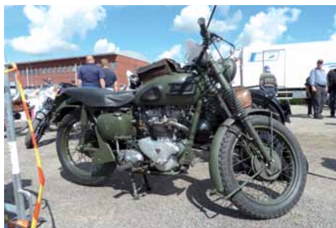
La Triumph Tiger 500 militare usata da Steeve Mac Queen nel film "La Grande Fuga"