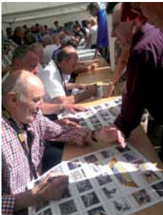
I 25 campioni del mondo svedesi firmano il manifesto commemorativo al pubblico presente.